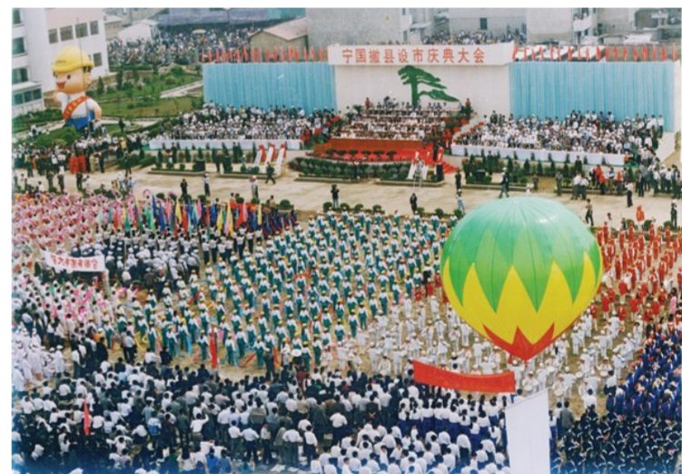
一九九七年五月一日宁国撤县设市庆典大会场景

回顾这段历史，点点滴滴的变化之中，都洋溢着无数山城人的精彩和感动。即日起，本版将推出《走过·我们的20年》系列报道，讲述一个普通人在这20年里生活中变化的故事，以此从侧面反应我市在20年里，经济、社会、城市建设等方面取得的成绩。