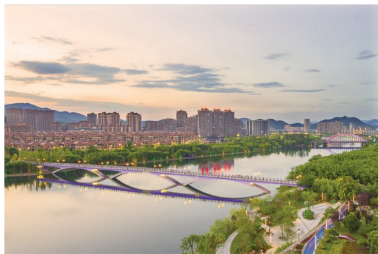
凤凰步行桥的变迁

岁月流金，时光更迭，辗转20年，山城里上演着沧桑巨变。一张老照片，可能就足以图说一段历史。20年前的宁国，城旧、路窄、楼矮，人们为生计而忙碌；20年后的今天，这里城美、路畅、楼高，人们为品质生活而追求。