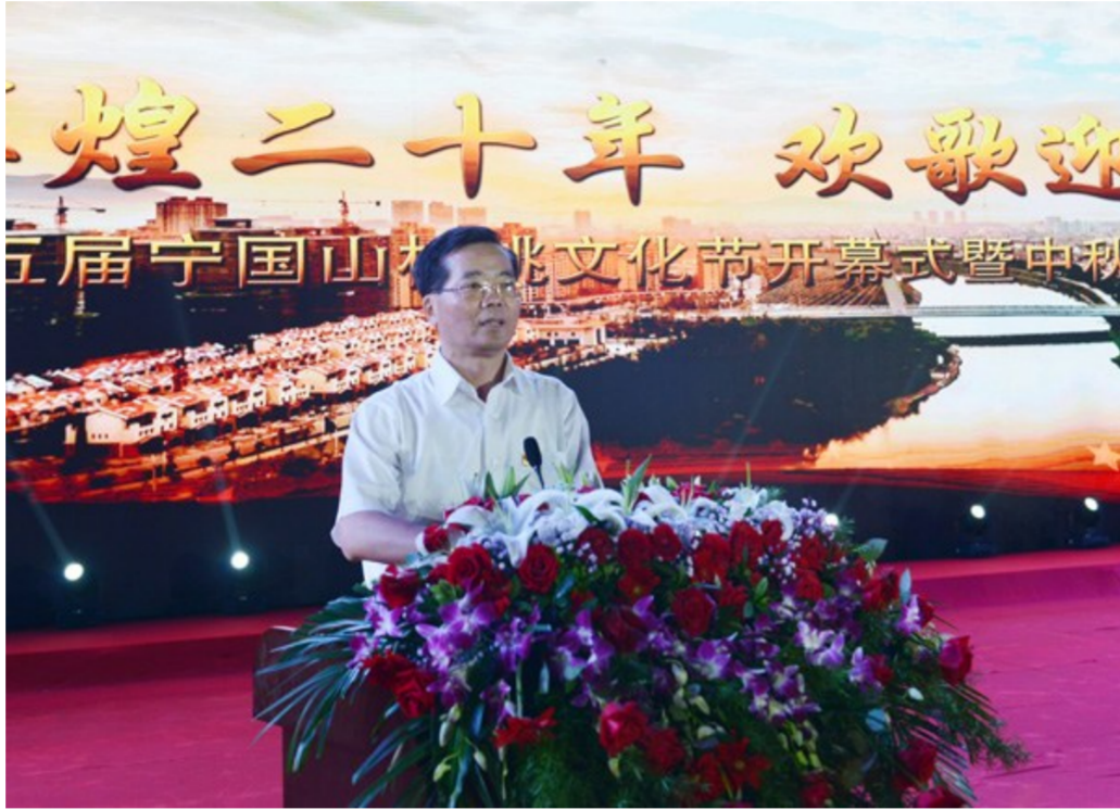
图为宣城市委书记韩军致开幕词

本报讯 仲秋时节，核桃飘香；山城宁国，激情飞扬。在全市上下喜迎党的十九大、同庆“撤县设市”20周年之际，第五届宁国山核桃文化节暨中秋文艺晚会9月28日在市奥林匹克中心隆重举行。宣城市委书记、市人大常委会主任韩军，省政府妇儿工委主任张若平，宣城市委常委、秘书长、宣传部长吴爱国，宣城市委常委、副市长、统战部长张黎勇，宣城市人大常委会副主任徐德美，宣城市政协副主席周鸣明，我市市委书记王普，市长何田，市人大常委会主任叶蕴，市政协主席饶培康，市委副书记吴忠梅等四大班子领导及省、宣城市有关领导、企业家出席。