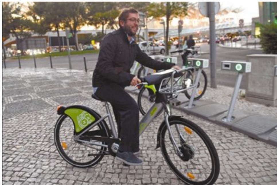
图为9月19日，在里斯本街头，市民使用共享单车。

据运营方里斯本市政府停车管理公司介绍，共享单车共有4种收费模式，年卡25欧元，月卡15欧元，日