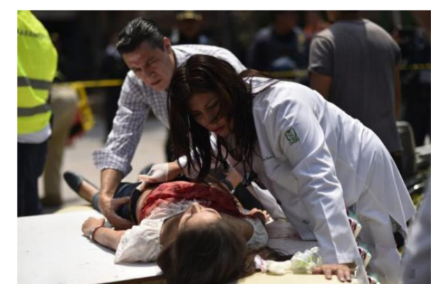
图为墨西哥医护人员救治在地震中受伤人员。

当地时间9月18日,墨西哥中部莫雷洛斯州发生7.1级地震,目前已导致数百人遇难。地震发生后