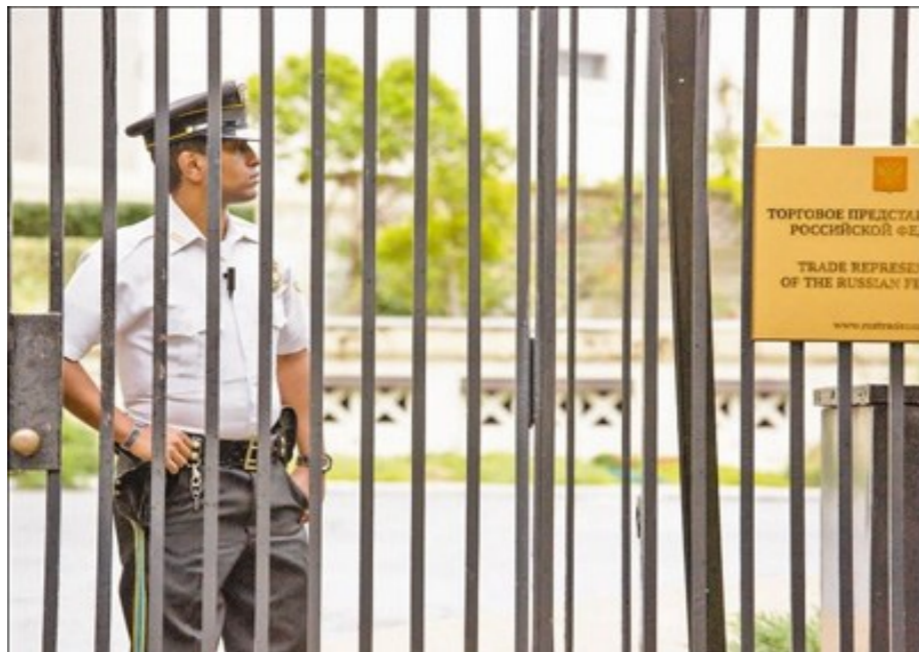
美俄外交关系自去年以来持续恶化，近来，两国更是相互驱逐外交人员，关闭外交设施。图为日前俄罗斯驻华盛顿的贸易代表团大楼被封，工作人员被禁止进入。

美俄外交关系自去年以来持续恶化，先是去年12月，美国前总统奥巴马离任前驱逐了35名俄驻美外交官，关闭了俄罗斯在美国两处所谓“用于情报活动”的房产。今年7月，美国众、参两院先后通过了制裁俄罗斯的议案。在随后德国汉堡举行的二十国集团峰会上，美国总统特朗普和俄罗斯总统普京举行了首次会晤，人们曾一度期望这次会晤能够融化阻碍双边关系前行的坚冰，然而这一愿望最终落空。两国总统会晤不到一个月，8月1日，特朗普签署了一项针对俄罗斯、伊朗和朝鲜三国的制裁法案。其中最严厉的一项内容就是针对俄罗斯的能源