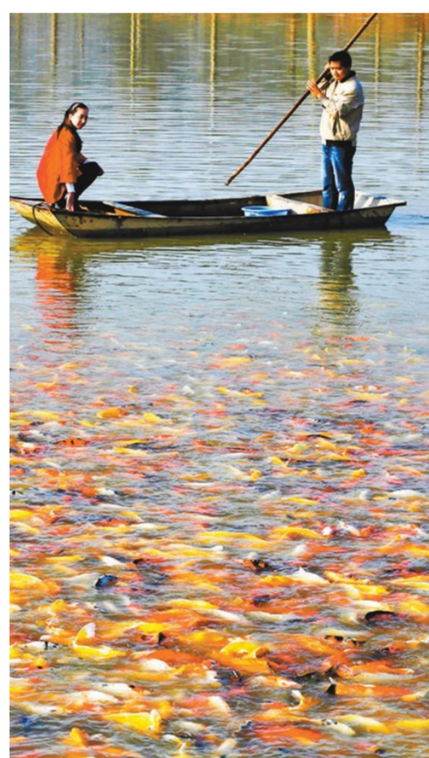
上图为:2016年11月4日,盱眙县的水质得到改善后,沿岸渔民利用淮河水养殖锦鲤增收。