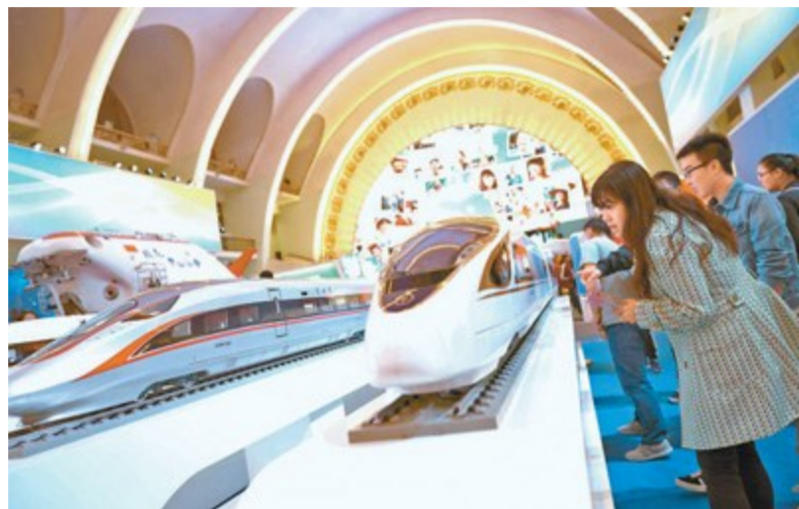
9月26日,观众正在参观“砥砺奋进的五年”大型成就展。

9月26日上午,“砥砺奋进的五年”大型成就展在北京开幕。展览通过“践行新发展理念 引领经济发展新常态”“坚持中国特色社会主义政治发展道路 推进国家治理体系和治理能力现代化”等10个主题内容展区和1个特色体验展区,全面宣传展示了党的十八大以来党和国家事业发生的历史性变革。京港两地青年和“圆梦中国人”百姓宣讲报告团中的几位先进典型在参观完展览后表示,祖国的变化让他们感到自豪,未来将继续努力,为伟大祖国贡献力量。