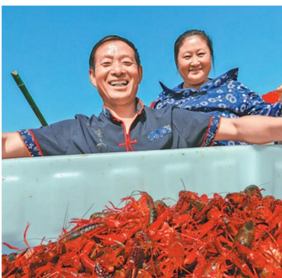
2017年5月17日,淮安市盱眙县利用淮河水养殖龙虾的渔民迎来了丰收。

洛伦索感谢习近平主席派特使专程出席其就职仪式,请特使转达他对习近平主席的亲切问候。他表示,在中国大力帮助下,安哥拉基础设施等领域建设取得较快发展,国家面貌发生巨大变化。安方高度重视发展对华关系,欢迎中方加大对安各领域投资,实现互利共赢、共同发展。